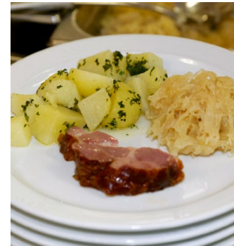
Mittagessen aus der Küche des Seniorenzentrums. Früchteteller als Zwischenverpflegung.